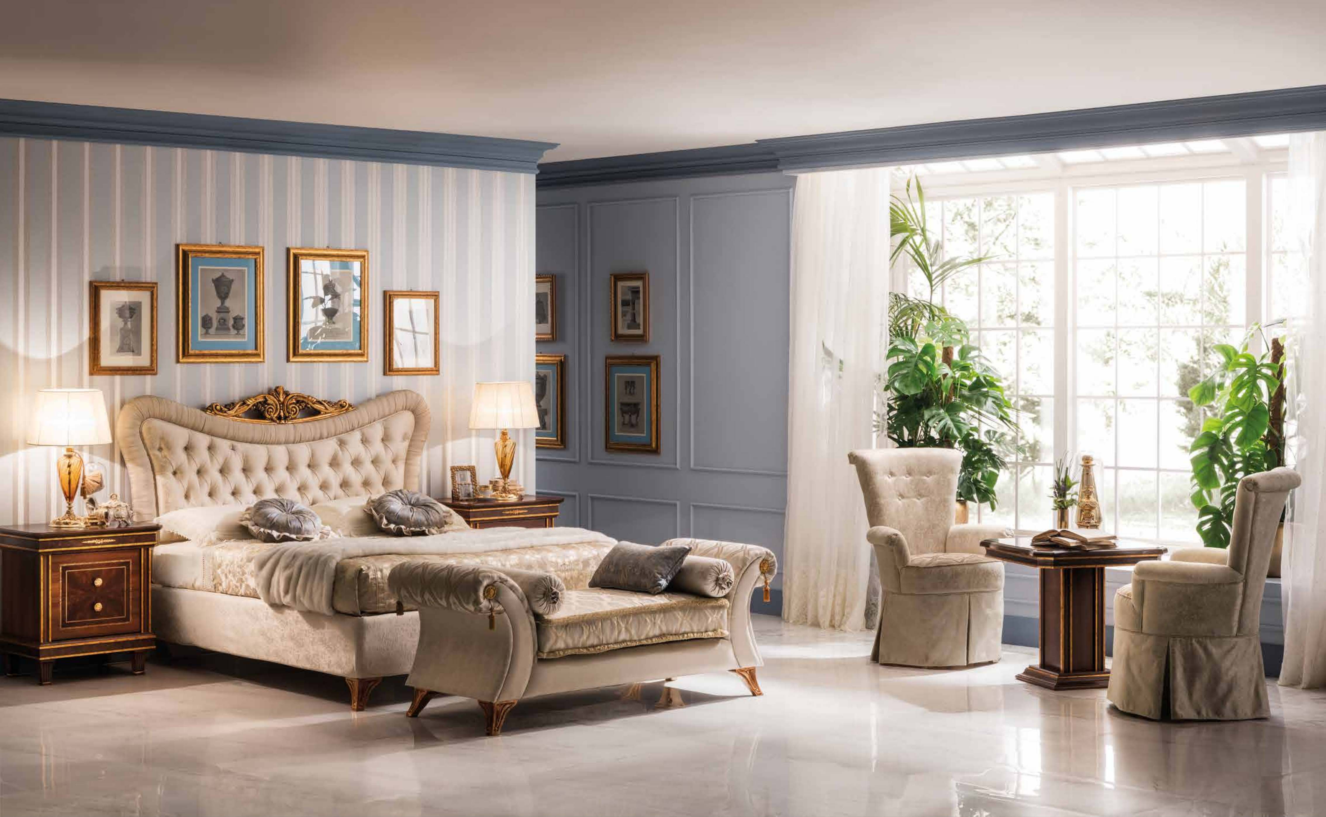
Bed - Letto - Кровать / Fabric - Stoffa - Ткань: Cat. "B" Alicante IT2 + Santa Paola IT3 Chaise longue / Fabric - Stoffa - Ткань: Cat. "B" Calp IT1 + Alicante IT2 + Santa Paola IT3 Armchair - Poltroncina - Кресло: Cat. "B" Calp IT1 + Alicante IT2