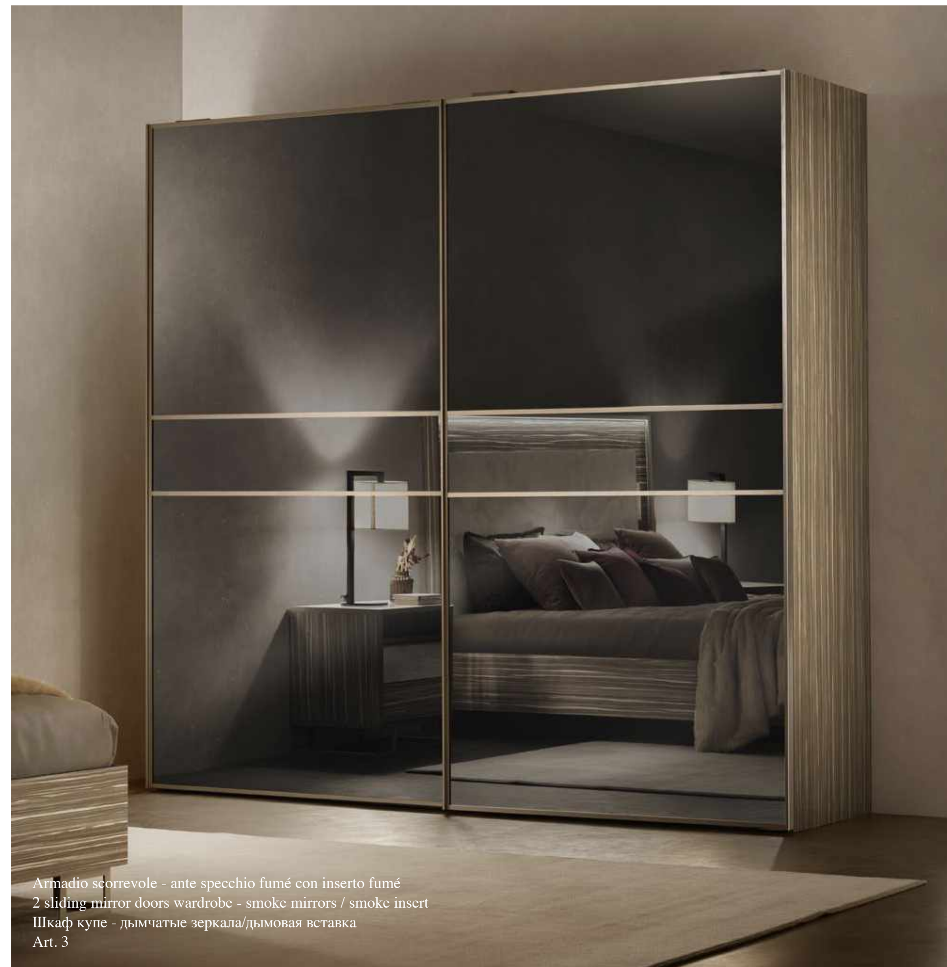
Armadio scorrevole - ante specchio fumé con inserto fumé 2 sliding mirror doors wardrobe - smoke mirrors / smoke insert Шкаф купе - дымчатые зеркала/дымовая вставка Art. 3