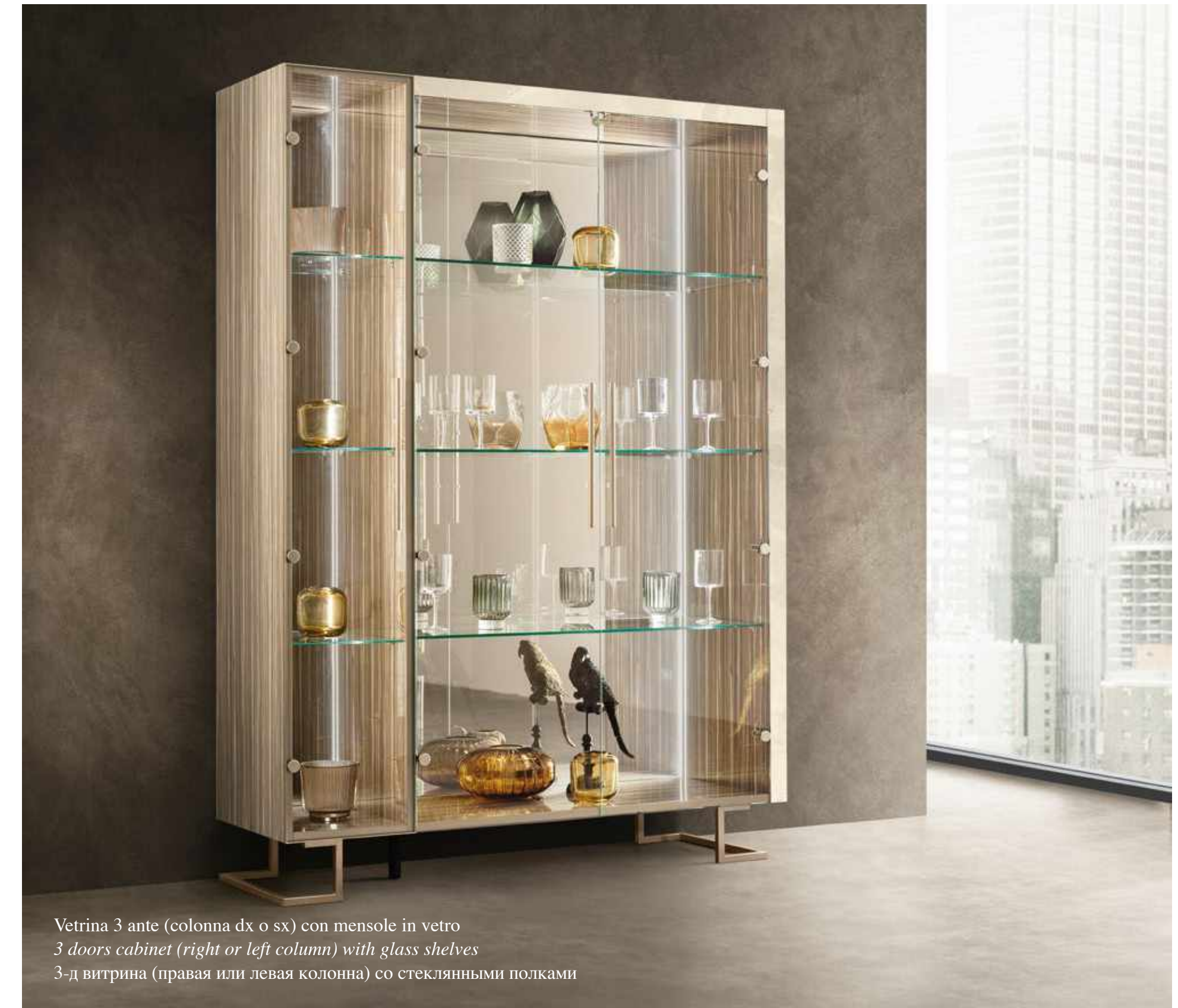
Vetrina 3 ante (colonna dx o sx) con mensole in vetro 3 doors cabinet (right or left column) with glass shelves 3-д витрина (правая или левая колонна) со стеклянными полками

Элегантность, игра света и модульный дизайн горки для гостиной, которая может быть «сконструирована» в соответствии с пожеланиями заказчика, с добавлением одностворчатого модуля справа и/или слева от центрального двустворчатого элемента.