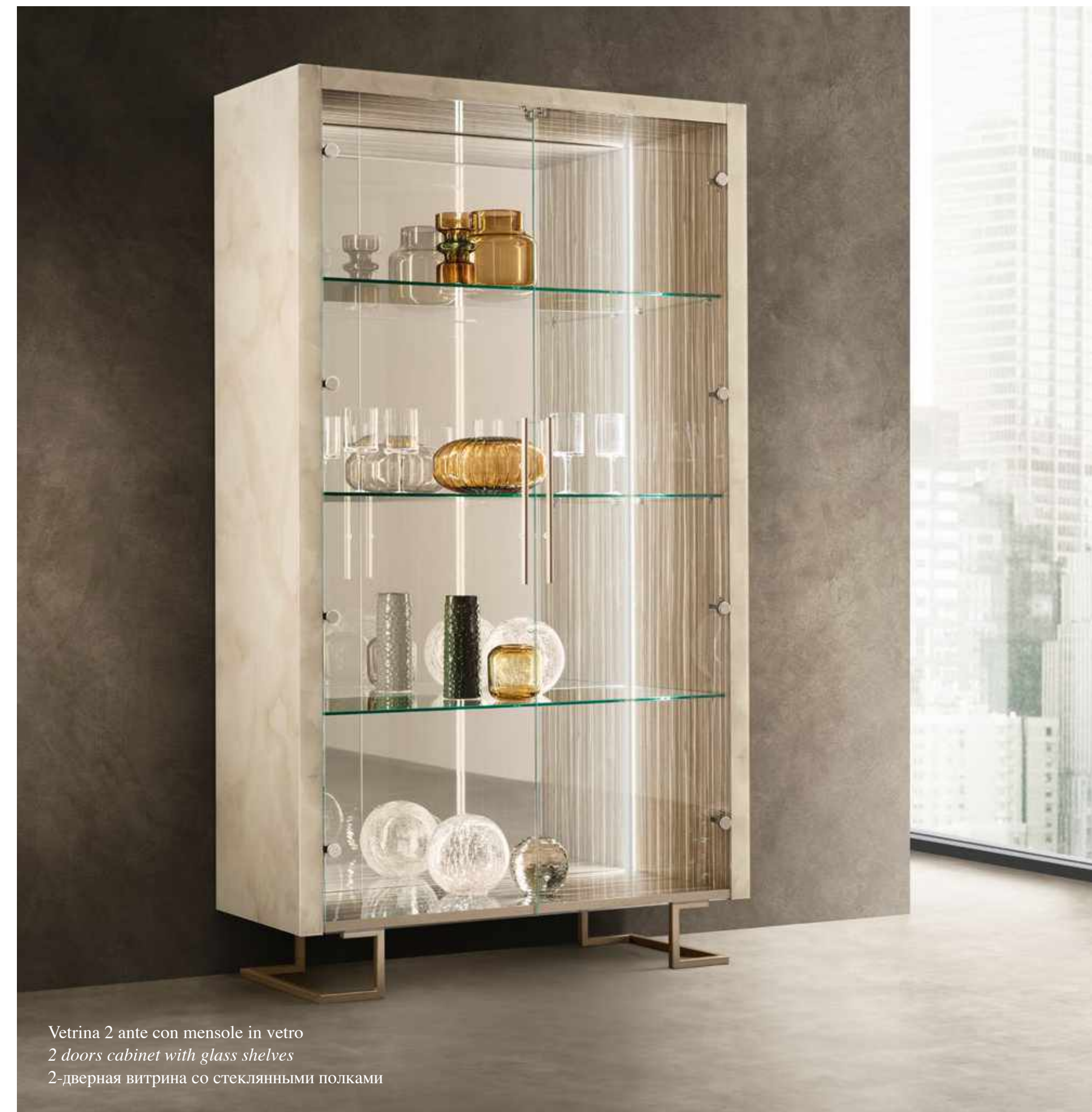
Vetrina 2 ante con mensole in vetro 2 doors cabinet with glass shelves 2-дверная витрина со стеклянными полками