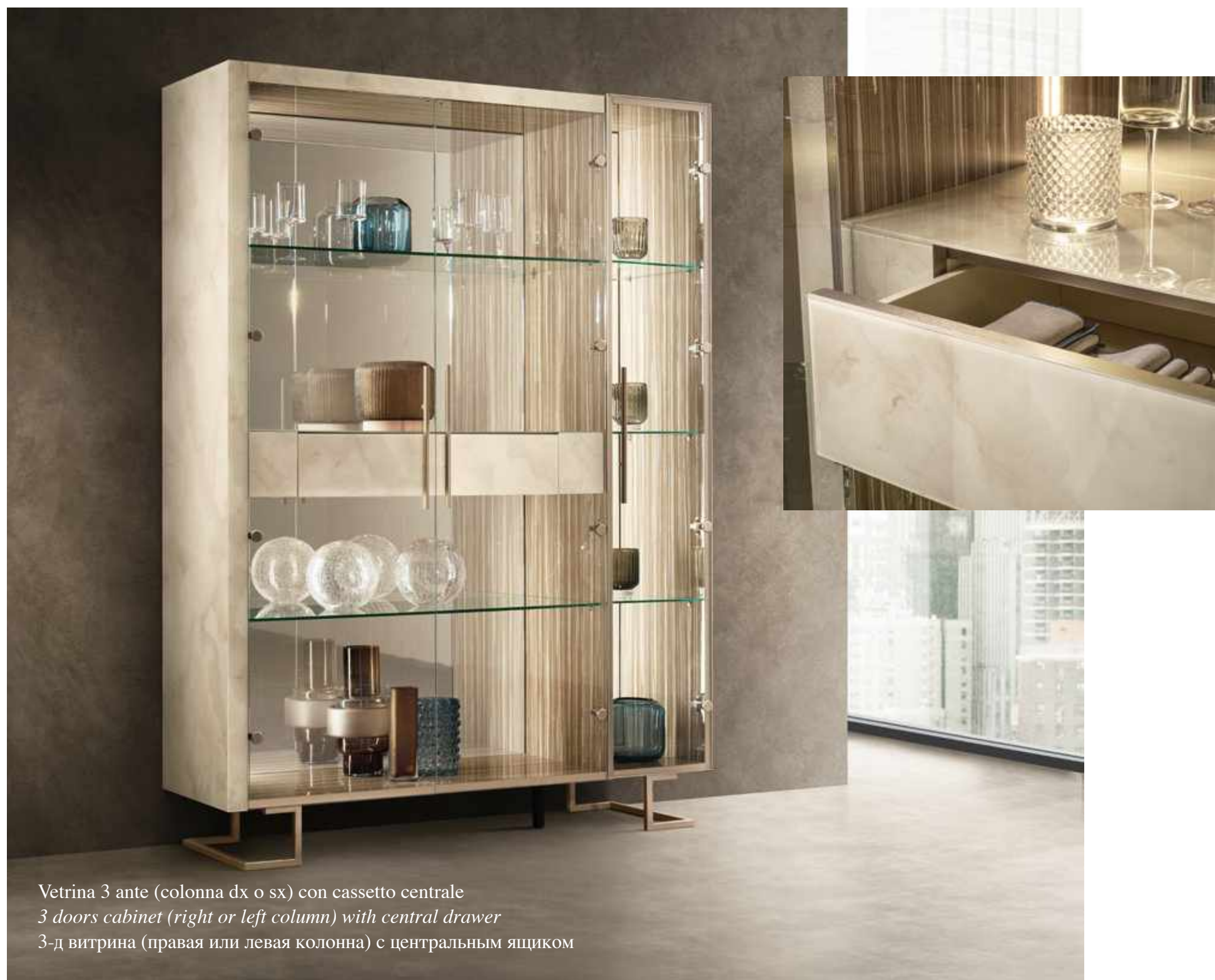
Vetrina 3 ante (colonna dx o sx) con cassetto centrale 3 doors cabinet (right or left column) with central drawer 3-д витрина (правая или левая колонна) с центральным ящиком

Еще одним элементом, позволяющим компоновать и персонализировать состав горки, является выдвижной ящик, который может устанавливаться в центральный двухдверчатый модуль, для увеличения его универсальности и вместимости. Внутренний объем ящика обтянут бархатом, а отделка наружной части из светлого оникса перекликается с аналогичным эффектом столешниц и боковин.