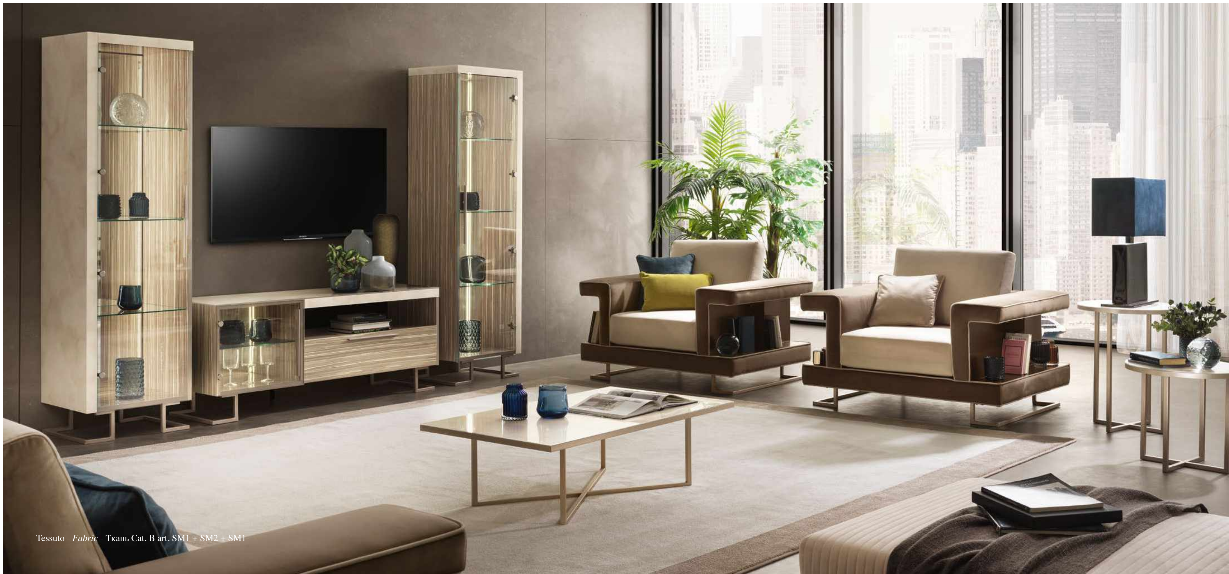
Tessuto - Fabric - Ткань Cat. B art. SM1 + SM2 + SM1